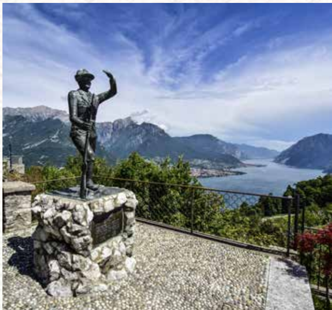
Veduta da Civenna.