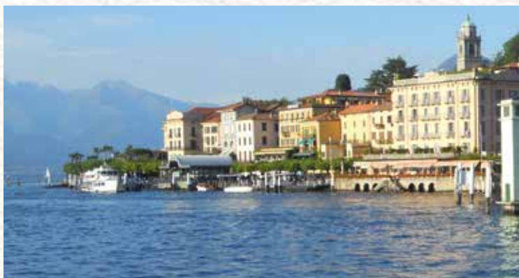
Bellagio. Il Borgo dal Lungolago.

CUCINA CASALINGA - SPECIALITÀ POLENTA UNCIA.