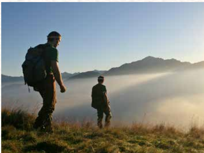
Bellagio. Passeggiata in montagna.

GPS RENTAL OR ITINERARIES INFO WITH MAPS.