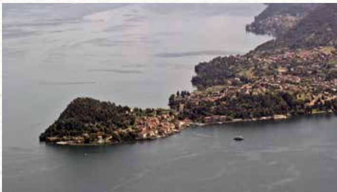
Veduta aerea di Bellagio.

Price includes: gasoline, insurance, delivery to a pier close to your hotel. Become a captain for one day and explore Lake Como from a totally different point of view.