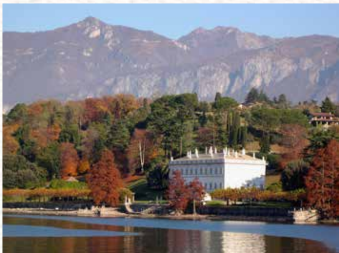
Villa Melzi in autunno