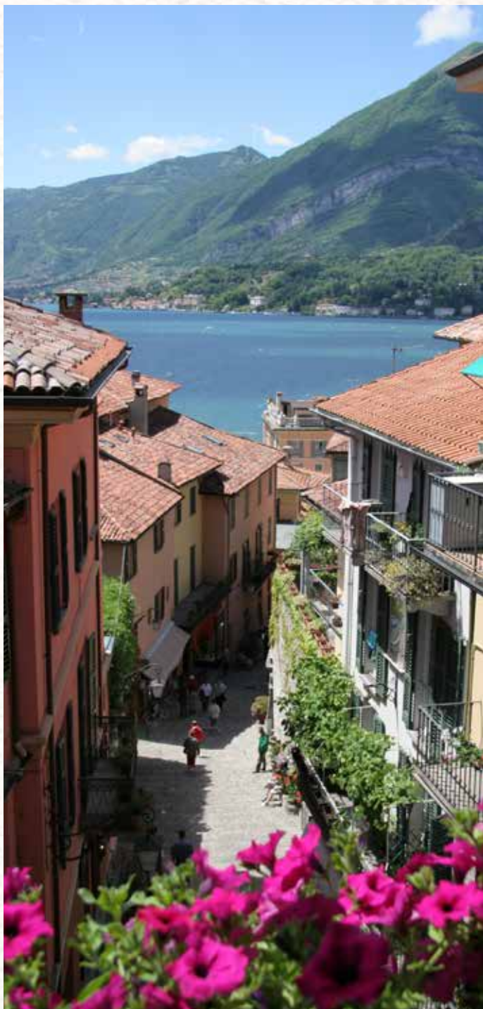
Bellagio. Salita Serbelloni.