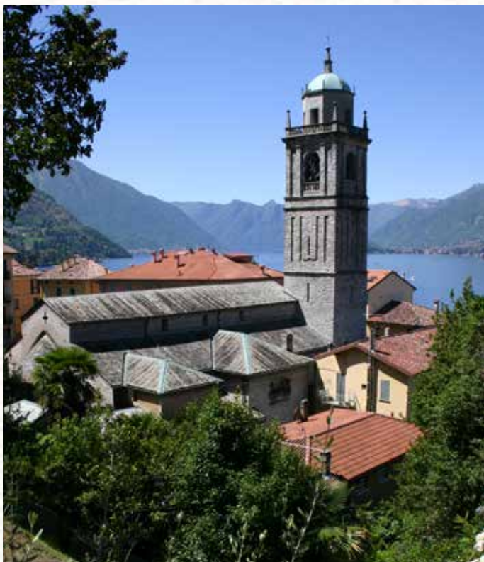
Bellagio. Basilica di San Giacomo.