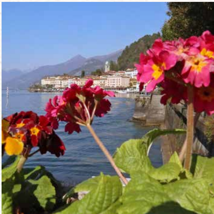
Bellagio. Veduta dal Lungolaro.

TYPICAL LOMBARDY MOUNTAIN DISHES. PIATTI TIPICI DELLA MONTAGNA LARIANA.